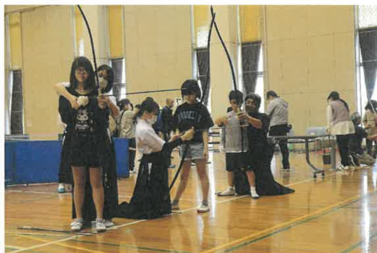
スポーツアドベンチャー