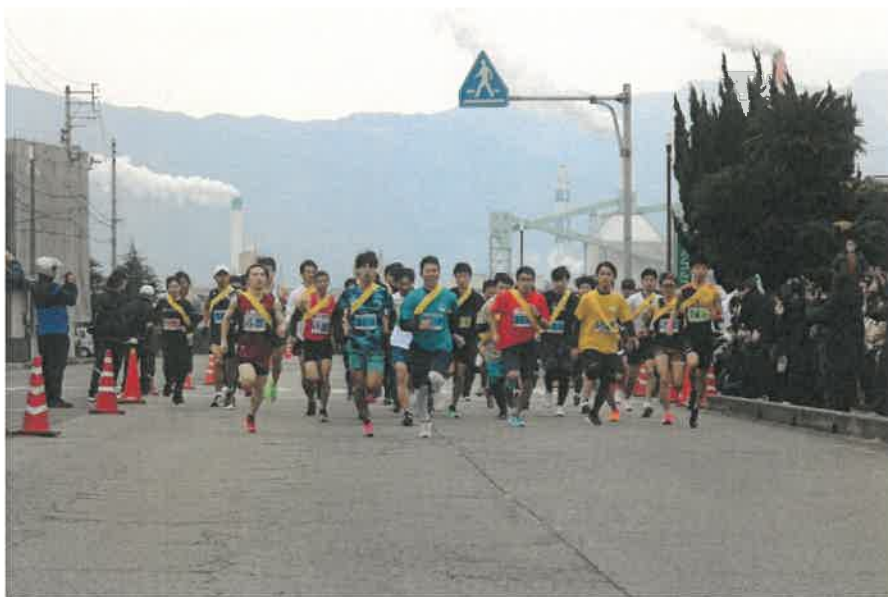
四国中央市駅伝競走大会