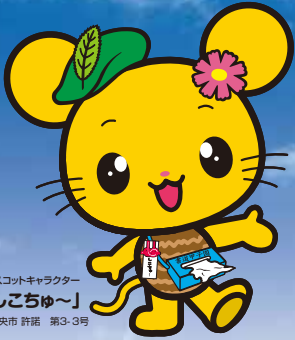
四国中央市マスコットキャラクター 「しこちゅ〜」 四国中央市 許諾 第3-3号