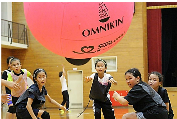
第5回しこちゅ〜 フォトコンテスト2018 大賞作品

当協会は、こうしたスポーツの力を主体的かつ健全に活用し、青少年の健全育成、地域における連帯感の醸成、医療費の削減、他市や他県との友好などを目標に、積極的に事業運営、施設管理を行い、施設を有効活用した事業等に取り組んでいきます。