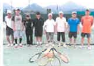
①NGTC ②ストレス発散!!!健康第一、親睦重視。