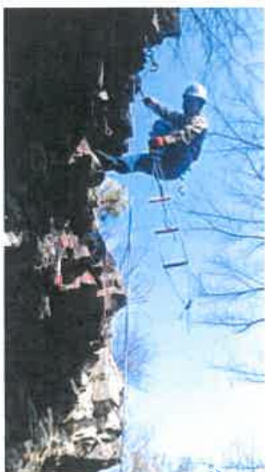
「ロッククライミング 【クライマー】」