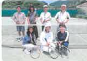
①SAC ②個人に合わせて☆健康第一！