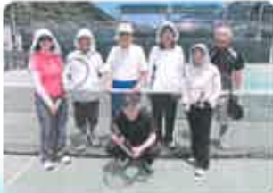
①KSC ③稲成約20年目！親睦重視♪