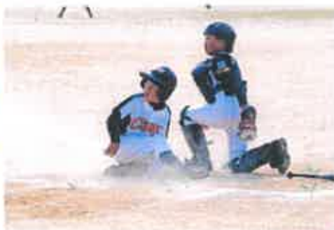
「どっちー？」