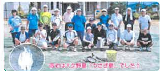
画(左)は上浦野島(「おさぎ島」)でした♪