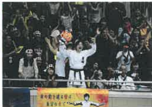
「みぎゃんも応援」