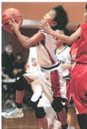
「決めてやる～!!」

「オムニキン」とは… 「すべての人が楽しめる スポーツ」という思い が込められたかけ声