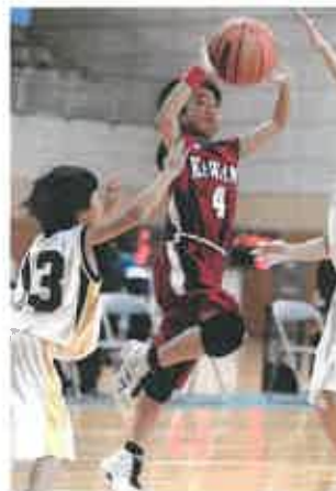
「入れ～!!」