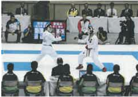
「息をのむ戦い」