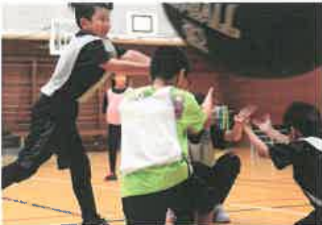
「オムニキン！」