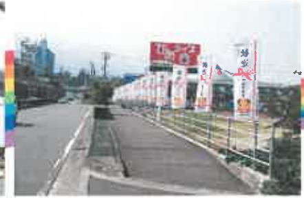
伊予三島運動公園体育館東側(JA広場前)