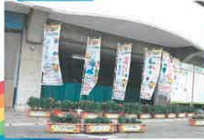
浜公園川之江球場