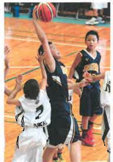
「しこちゅ～のバスケットマン」