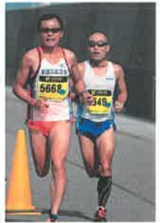
「ライバル」