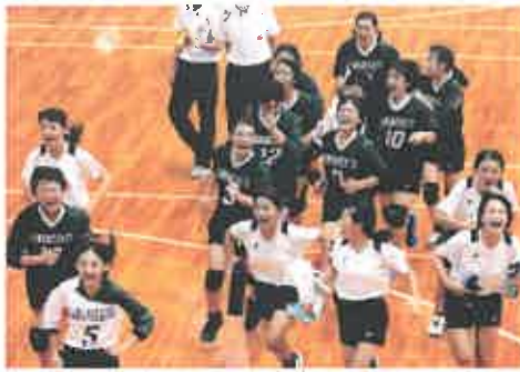
「歓喜(かんき)」