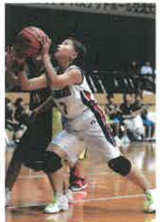
「ゴールが見えた!!」