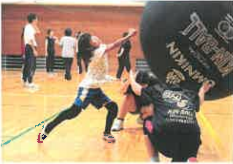
「キンボール」