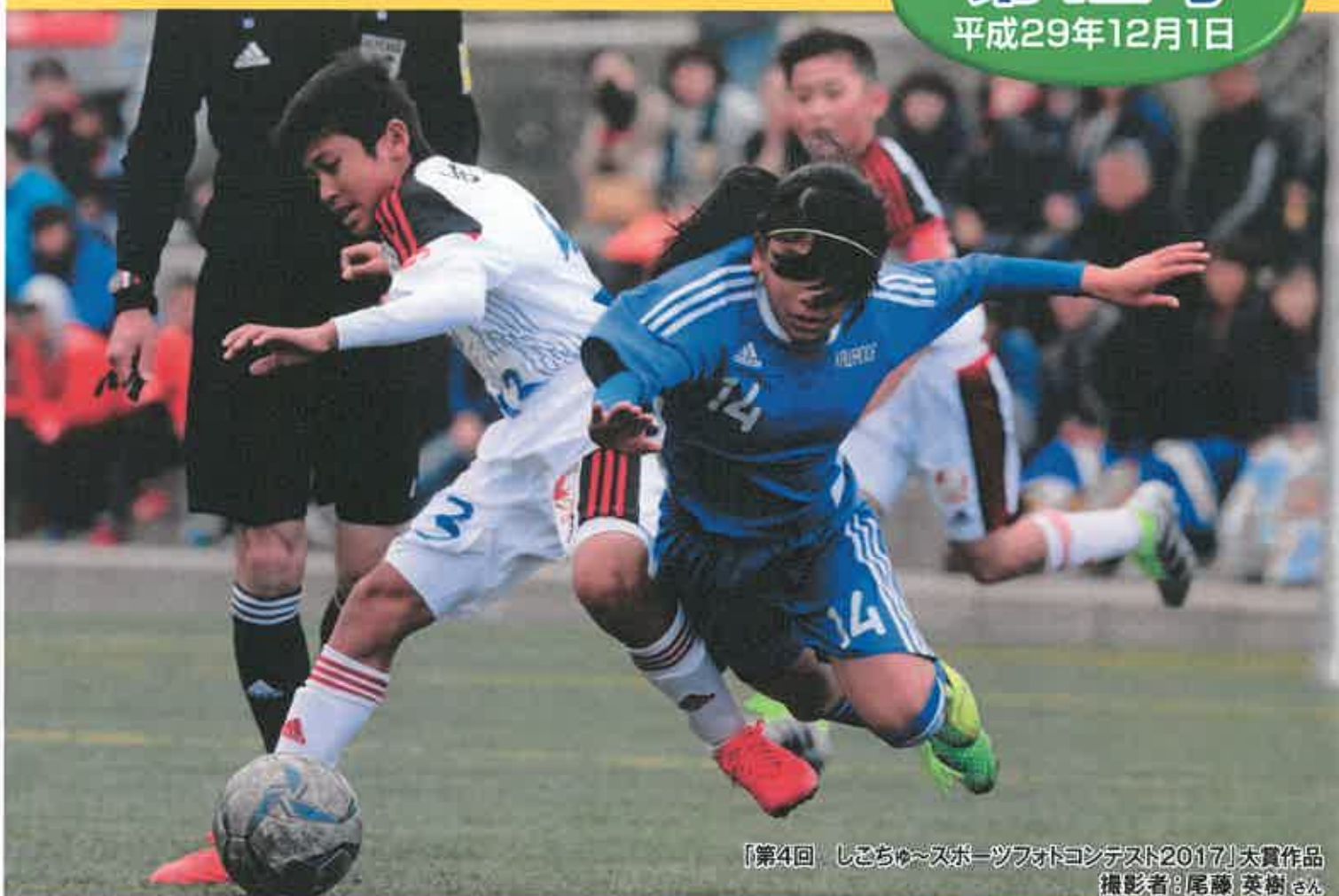
【第4回 しこちゅ〜スポーツフォトコンテスト2017】大賞作品