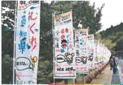
スカイフィールド富郷

市内の全小学校で応援メッセージを書いたのぼり旗を含め、各会場周辺に約200本設置しました。また、三島・川之江インターチェンジから競技会場までの主要道路である11号バイパスを中心に1200本ののぼり旗を設置し、開催ムードを盛り上げました。